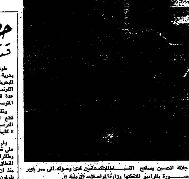
جلالة الحسين يصافح الضباط البريطانيين لدى وصوله الى مور خير